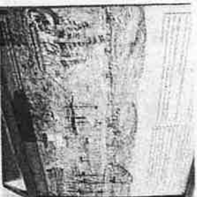
Rafaela Ban i Ervin Dubrovčić

– Cilj je usredotočiti se na povezanost grada i luke s kojom je rastao i razvijao se od svojih početaka do današnjih dana –